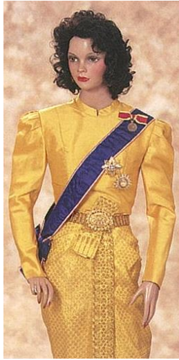
ชุดไทยเต็มยศ

โดยมีวิธีการประดับเครื่องราชอิสริยาภรณ์เช่นเดียวกับหน้า ๔ - ๑๘ ถึง ๔ - ๒๑