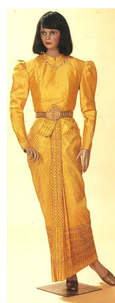
ชุดไทยบรมพิมาน