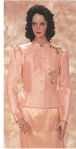
ชุดไทยครึ่งยศ