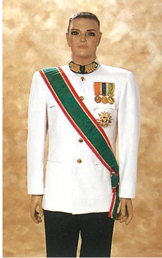
ชุดขอเฝ้าเต็มยศ

โดยมีวิธีการประดับเครื่องราชอิสริยาภรณ์เช่นเดียวกับหน้า ๔ - ๑๕ ถึง ๔ - ๑๗