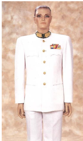
ชุดขอเฝ้าปกติขาว