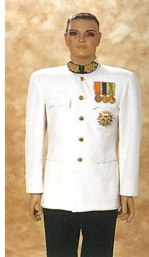
ชุดขอเฝ้าครึ่งยศ