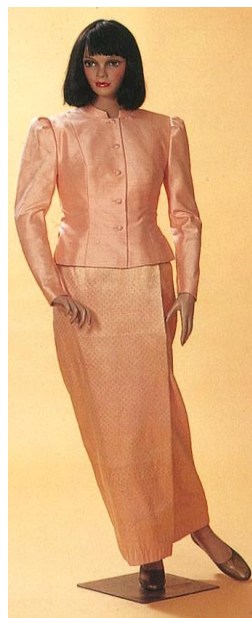
ชุดไทยอมรินทร์