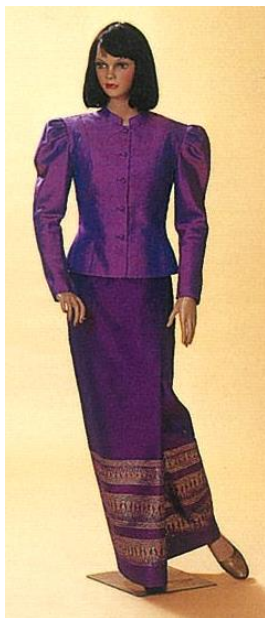
ชุดไทยจิตรลดา